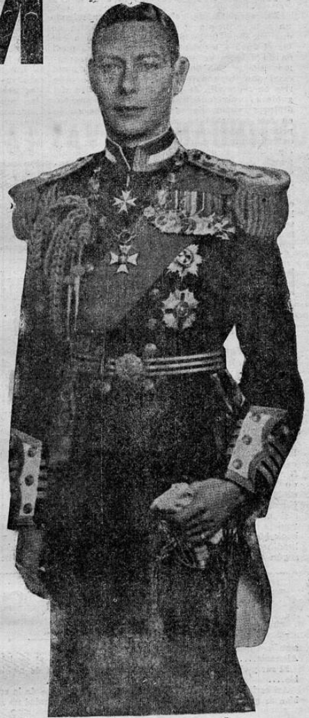
JORGE VI, REY DE INGLATERRA

En fuentes que nos merecen absoluto crédito hemos sabido de la determinación que han a- bordado los profesionales aboga- dos de las ciudades de Cartago y Heredia para mantener cerrados sus bufetes en los días dom- ingos y feriados, tal como des- de hace mucho tiempo lo hacen los de esta ciudad capital. A par- tir del domingo venidero pon- (Pasa a la Página OCHO)